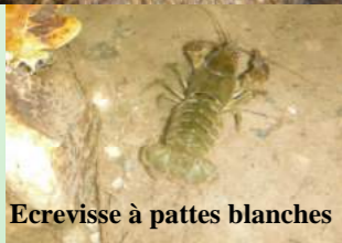
Ecrevisse à pattes blanches